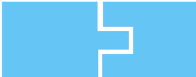
Corte perimetral y superficie